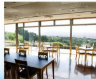
レストラン「海陽亭」