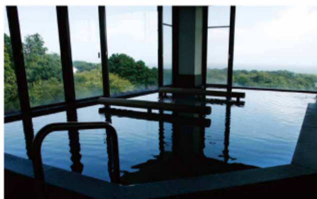
「澄んだ海」「紺碧の海」「鬱蒼たる樹木」「伊豆大島」を一望！…男湯：漁火の湯