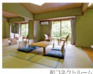
和コネクトルーム

洗練された空気が漂う和風室、木のぬくもりを感じるくつろぎの和室。あなた好みのこだわりのスタイルで旅の疲れを癒していただけます。